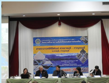
วิทยากรตอบข้อซักถาม