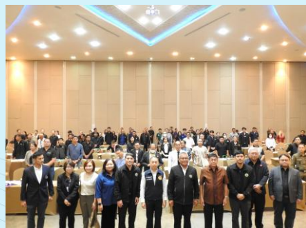
ผู้เข้าร่วมประชุมถ่ายภาพเป็นที่ระลึกร่วมกัน