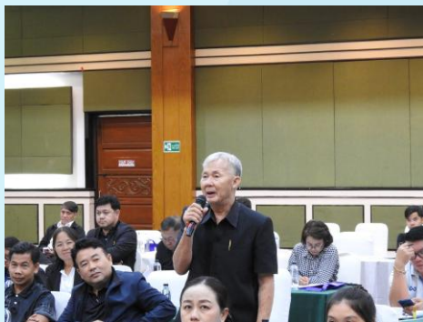
ผู้เข้าร่วมประชุมแสดงความคิดเห็น