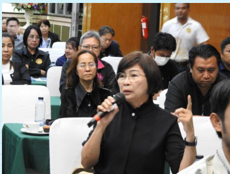
ผู้เข้าร่วมประชุมแสดงความคิดเห็น