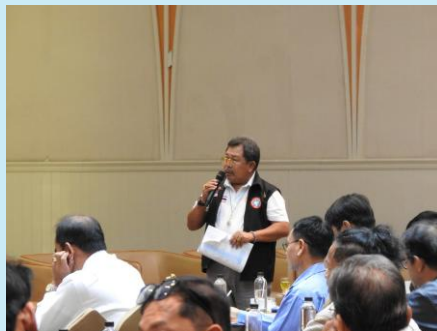
ผู้เข้าร่วมประชุมแสดงความคิดเห็น