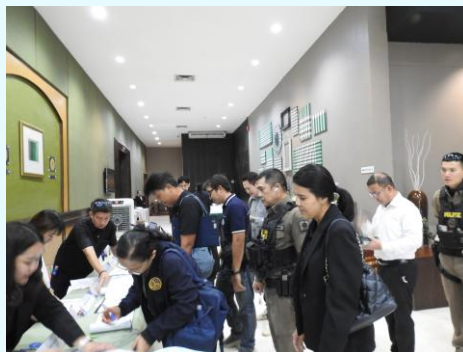
ผู้เข้าร่วมประชุมลงทะเบียน รับเอกสารประกอบการประชุม