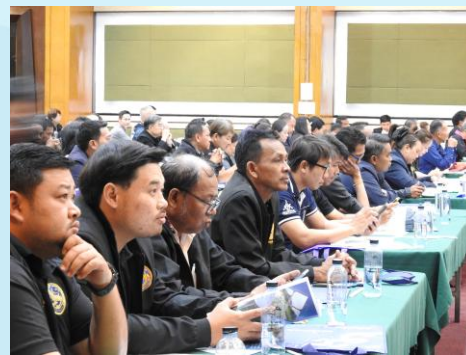
ผู้เข้าร่วมประชุมรับฟังรายละเอียดโครงการ