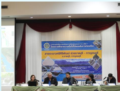
วิทยากรนำเสนอรายละเอียดโครงการ