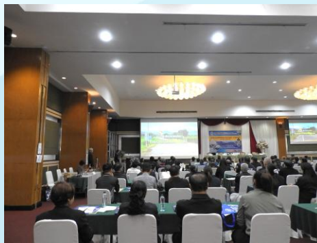
ผู้เข้าร่วมประชุมรับชมวิดีโอทัศน์