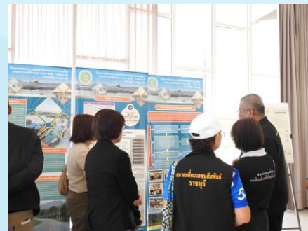
ผู้เข้าร่วมประชุมรับชมบอร์ดนิทรรศการ