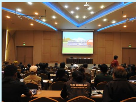
ผู้เข้าร่วมประชุมรับชมวีดิทัศน์