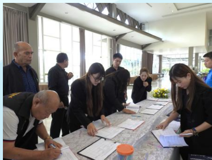
ผู้เข้าร่วมประชุมลงทะเบียน รับเอกสารประกอบการประชุม