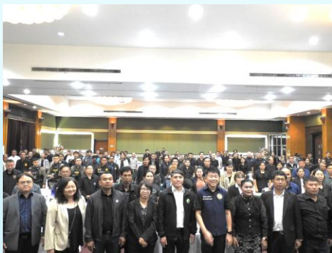
ผู้เข้าร่วมประชุมถ่ายภาพเป็นที่ระลึกร่วมกัน